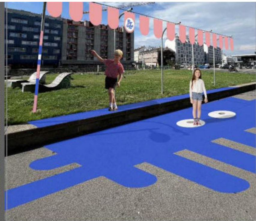
08 - Zeichenfläche 3 Kopie 5