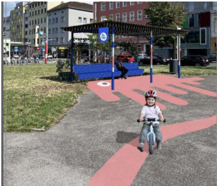
04 - Zeichenfläche 3 Kopie