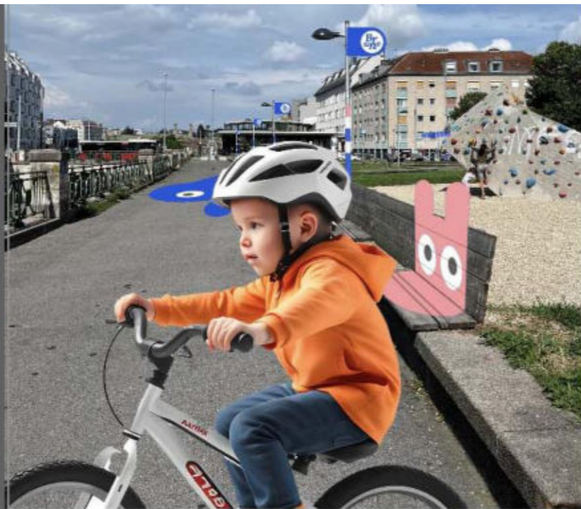
05 - Zeichenfläche 3 Kopie 2